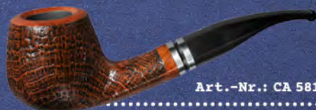
Art.-Nr.: CA 581