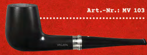
Art.-Nr.: MV 103