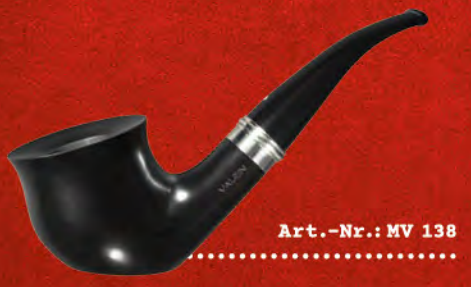
Art.-Nr.: MV 138