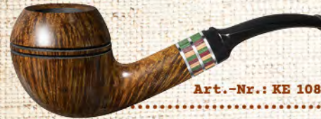
Art.-Nr.: KE 108