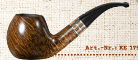
Art.-Nr.: KE 179