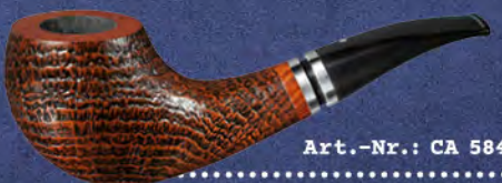
Art.-Nr.: CA 584

In der zweiten Variante, die robuste Sand-Ausführung, ergibt sich durch das Relief der Sandstrahlung eine vergrößerte Oberfläche, die zu einer verbesserten Wärmeableitung führt.