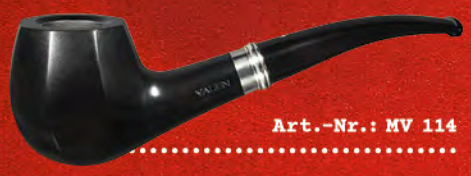
Art.-Nr.: MV 114