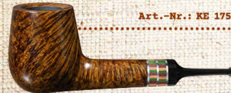
Art.-Nr.: KE 175