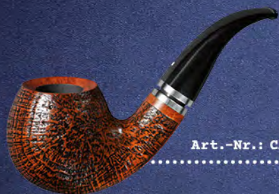
Art.-Nr.: CA 519