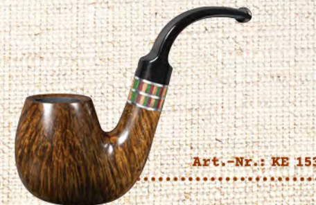
Art.-Nr.: KE 153