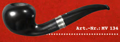
Art.-Nr.: MV 134

Mit Schirm, Charme und Melvin. Diese Edition könnte das Outfit eines britischen Gentlemans perfektionieren - zeitlos und elegant. Das seidenmatte Schwarz in maximaler Farbbrillanz und die Ringkombination an Holm und Mundstück verleihen der MELVIN das besondere Charisma. Very British. Very MELVIN .