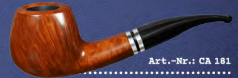
Art.-Nr.: CA 181