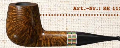
Art.-Nr.: KE 111