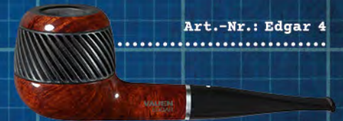
Art.-Nr.: Edgar 4