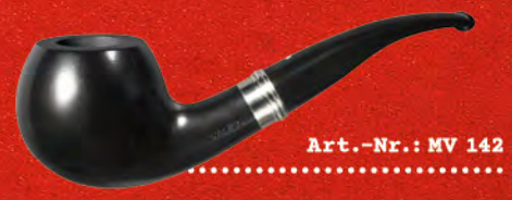
Art.-Nr.: MV 142