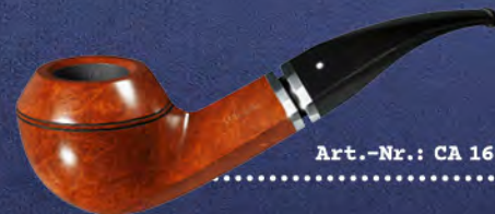
Art.-Nr.: CA 168