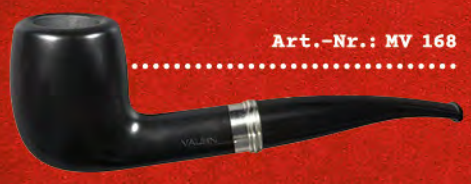
Art.-Nr.: MV 168