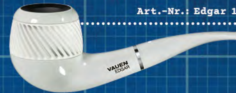
Art.-Nr.: Edgar 1