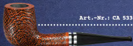
Art.-Nr.: CA 533