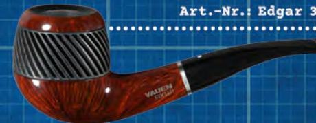
Art.-Nr.: Edgar 3