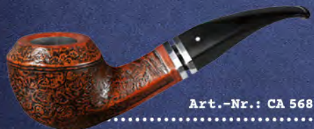
Art.-Nr.: CA 568