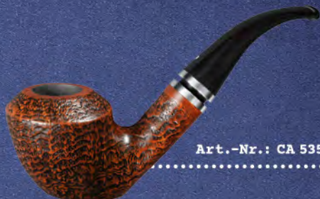
Art.-Nr.: CA 535