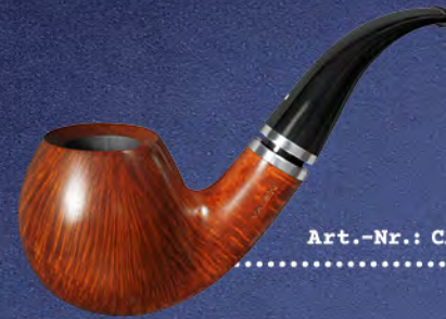
Art.-Nr.: CA 119