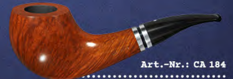
Art.-Nr.: CA 184

In der Edition CALETTA kommt die Natürlichkeit des Bruyère-Holzes ganz pur zur Geltung. Sie gibt es in zwei Ausführungen: In der glatten Version betont die helle Farbe die schöne Maserung besonders gut. Bei beiden Varianten fällt im Design die außergewöhnliche Ringkonstruktion auf: zwei polierte, silberfarbene Ringe am Holm und am Mundstück mit einer abgesetzten, schwarzen Nut. Eine Pfeife reinsten Raffinesse.