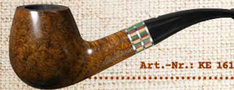
Art.-Nr.: KE 161