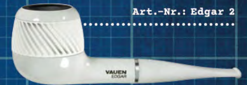
Art.-Nr.: Edgar 2