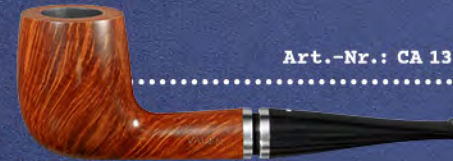
Art.-Nr.: CA 133