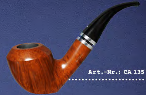
Art.-Nr.: CA 135