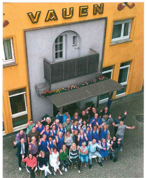
Foto VAUEN-Team heute

Damit schreibt das Familienunternehmen Geschichte. Es ist mittlerweile der einzige deutsche Pfeifenhersteller. Mit Menschlichkeit, Zusammengehörigkeit und Begeisterung für das tägliche Denken und Handeln geht es weiter in eine erfolgreiche Zukunft mit handgefertigten Produkten.