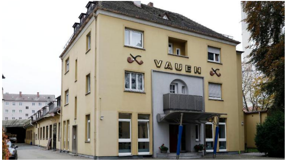
Der Firmensitz in Nürnberg-Steinbühl

Wichtigster Grundstoff für „eine VAUEN“ ist Bruyère-Holz, das Wurzelholz der Baumheide. Alexander Eckert: „Es hat eine unglaubliche Festigkeit“. Die ist nötig, denn es muss Temperaturen bis zu 500 Grad aushalten.