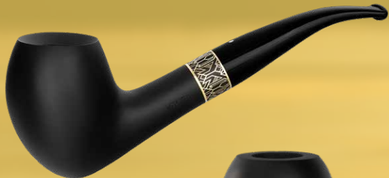
◦ Art.-Nr. JY 141