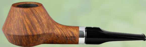
◦ Art.-Nr. Felix 3