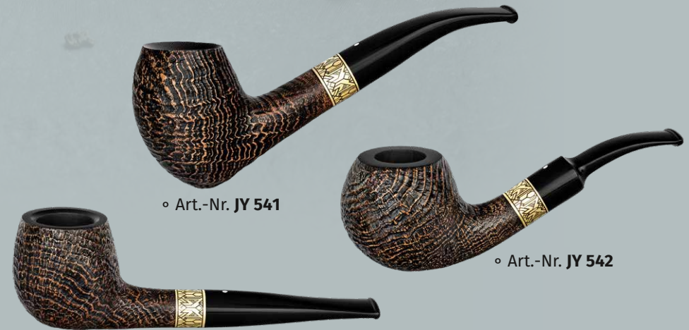
◦ Art.-Nr. JY 541