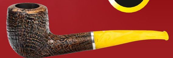
◦ Art.-Nr. LS 568