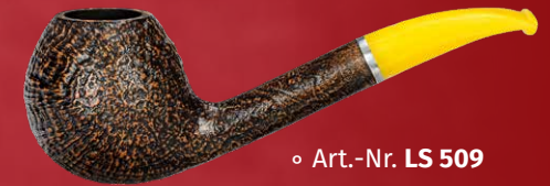
◦ Art.-Nr. LS 509