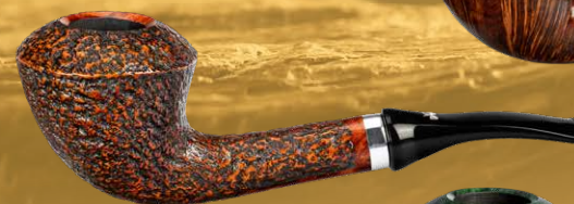
◦ Art.-Nr. J2024 R rustiziert