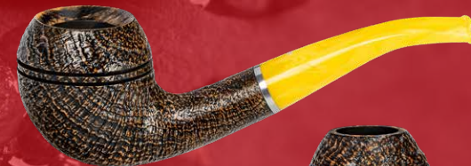
◦ Art.-Nr. LS 508