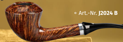
◦ Art.-Nr. J2024 B