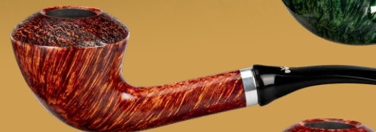
◦ Art.-Nr. J2024 CO teilsandgestrahlt