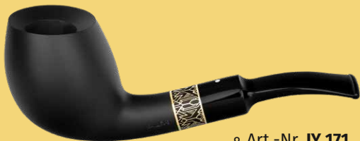
◦ Art.-Nr. JY 171