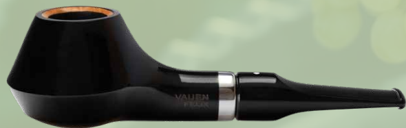
◦ Art.-Nr. Felix 1

Die Designerpfeife ist in drei Farbvariationen erhältlich – Hochganz weiß, Hochglanz schwarz oder braun – und wird dabei von besonderen Mundstückausführungen begleitet. Präsentiert wird unser Modell Felix in einer schönen Schmuckverpackung .