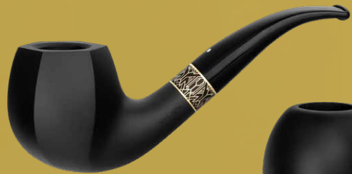
◦ Art.-Nr. JY 106

Die sechs verschiedenen Formen bieten Vielfalt und Individualität. Genießen Sie Ihren Wodka Martini stilvoll, begleitet von der Jay, die eine Brücke zwischen dem zeitlosen Cocktail und der Kunst der Tabaktradition schlägt.