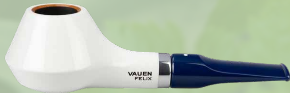
◦ Art.-Nr. Felix 2