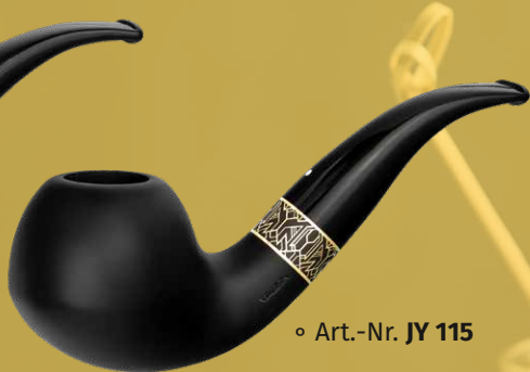
◦ Art.-Nr. JY 115