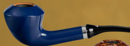
◦ Art.-Nr. J2024 A

Die Jahrespfeife 2024 wird so zu einem visuellen Erlebnis , welches die Kunst des Tabakgenusses mit der Finesse eines hochwertigen Whiskys verbindet. Wählen Sie aus den faszinierenden Ausführungen Ihren Favoriten und lassen Sie sich von dieser einzigartigen Pfeife zu einem Jahr voller sinnlicher Genussmomente entführen – exklusiv, limitiert und einzeln nummeriert .