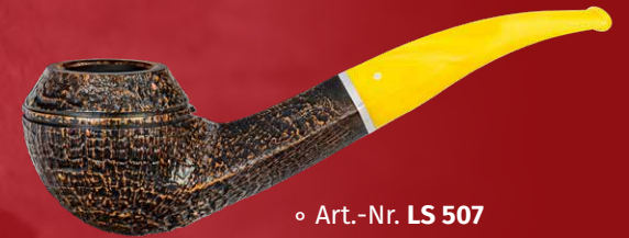
◦ Art.-Nr. LS 507