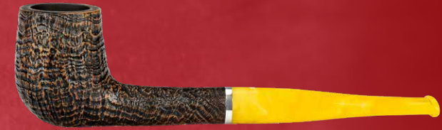
◦ Art.-Nr. LS 504

Das gelbe Mundstück verleiht der Pfeife nicht nur eine markante Erscheinung , sondern schafft auch eine visuelle Verbindung zum charakteristischen Farbton des Negroni Cocktails. Die Weißpunktserie Lessing wird so zu einem Accessoire , das nicht nur die Kunst des Rauchens, sondern auch den Genuss des Getränks zelebriert.