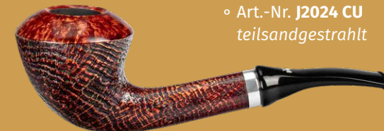
◦ Art.-Nr. J2024 CU teilsandgestrahlt