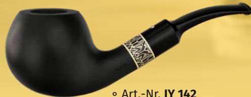
◦ Art.-Nr. JY 142