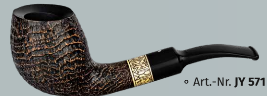
◦ Art.-Nr. JY 571