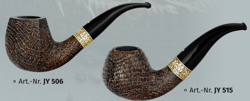
◦ Art.-Nr. JY 506

Auch in der Sandversion trifft die Jay mit ihren sechs unterschiedlichen Formen eine breite Geschmackspalette. Der Messingring, als Zeuge vergangener Jahrzehnte, verbindet die Welt des Tees mit der Kunst des Rauchens . Tauchen Sie ein in die entspannte Atmosphäre eines Teemoments, begleitet von der zeitlosen Jay, die die Symbiose von Tabakgenuss und Teekultur perfekt vereint.