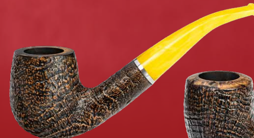
◦ Art.-Nr. LS 527